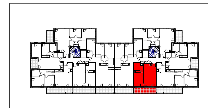
TABLEAU DES SURFACES HABITABLES